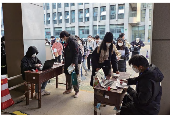
图为考生通过指示牌扫码了解考场路线、有序进场