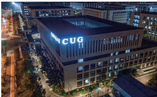
图为校园文化设计标志