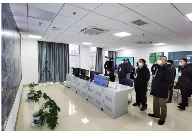
图为校领导巡视监控室监考情况

我校在考试组织服务中为考生们营造安全稳定的考试环境，为考生们提供温馨周到的服务。研究生院提前制作发布了自命题考试条形码粘贴等服务、提示小视频，提醒考生考试时的具体操作，避免失误。为了方便考生现场快速准确进入考场，研究生院精心制作了指引地图，标明进场路线、考场具体位置、食堂及休息场所等，为考生导引路线，缓解紧张情绪；制作了指引牌及门贴，方便考生迅速进场，避免聚集；设置了临时准考证打印服务点，为证件损坏遗失的考生提供便利；为突发高烧等状况的考生提供紧急医疗护理，配送盒饭等，主动服务帮助考生顺利安心应考。