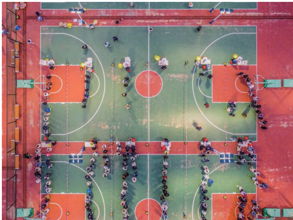
图为核酸检测现场

3月，奥密克戎来势汹汹，许多同学经历凌晨起床做核酸，许多同学参与了一线流调筛查。2022年校区组织了150余场核酸，800余名教师志愿者参与，核酸人次达到85万人次，隔离点接收临时人员1697人次，我们人人都是防疫员！