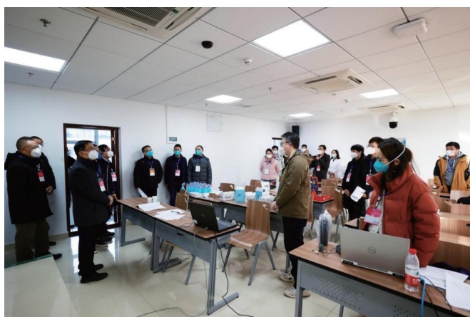
图为校领导慰问工作人员