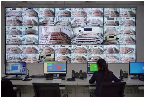
图为监控室考场检查现场