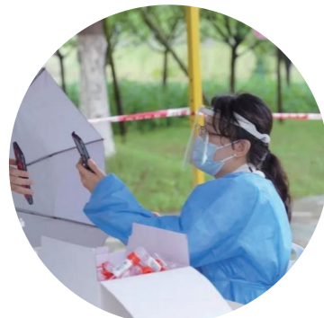
图为核酸志愿者正在扫码