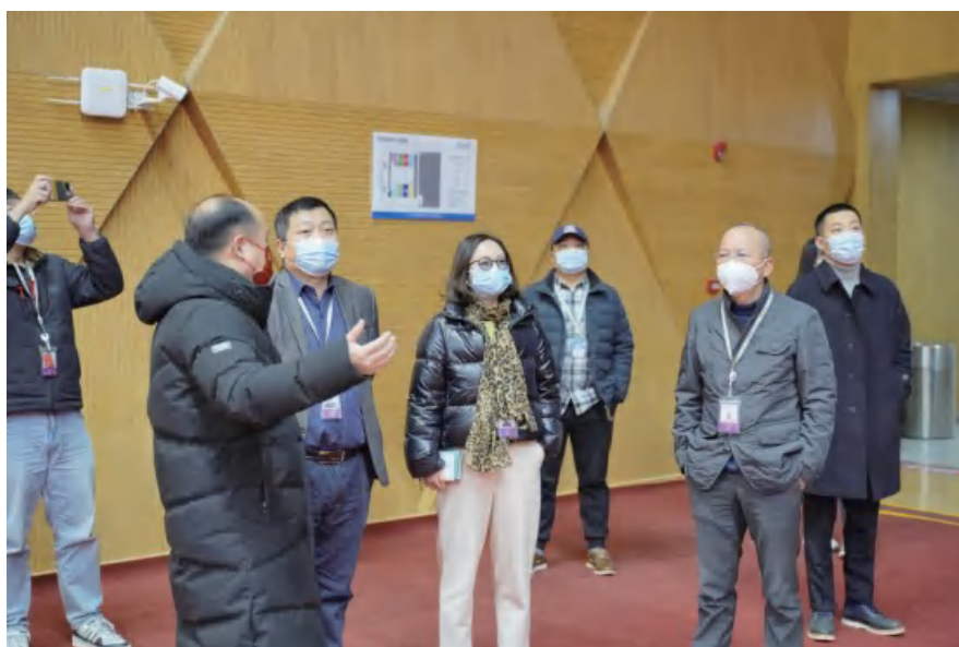
图为长江存储一行人员走访调研现场

长江存储一行人员实地察看了游泳馆、篮球馆、健身房、羽毛球训练场等场所，详细了解了未来体育馆管理运行情况。