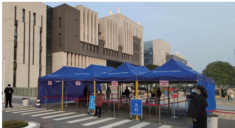
图为四六级进场入口处

本次全国大学英语四、六级考试不仅是对考生的一次“大考”，也是对学校考试组织工作的一次“大考”，考验的是广大教职工的乐于奉献，考验的是全校师生的众志成城。在全校师生同心协力和各部门通力支持下，我校全国大学英语四、六级考试井然有序。（编辑 王俊芳 审稿 陈华文）