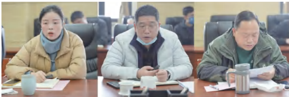
图为校区管理办领导班子成员汇报

会上，全体参会人员秉承公平、公开、公正原则完成了校区管理办及班子成员民主测评，并评选出2022年度考核优秀人员名单。