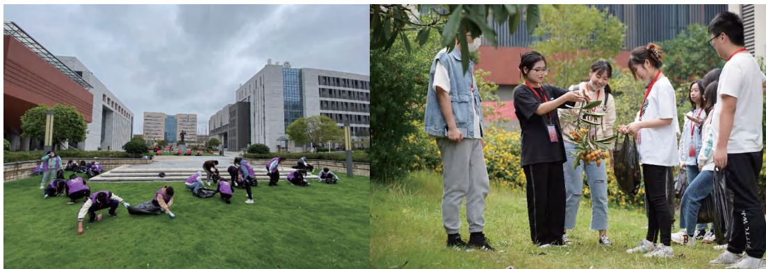
图为志愿活动现场

4月镜湖畔放生锦鲤，5月枇杷树下摘果实，小心地踩上柔软细腻的草坪，拾起一片松脆泛黄的落叶。2022年校区组织了32场劳动实践，900余名学生参与其中，投身劳动，感受生活。