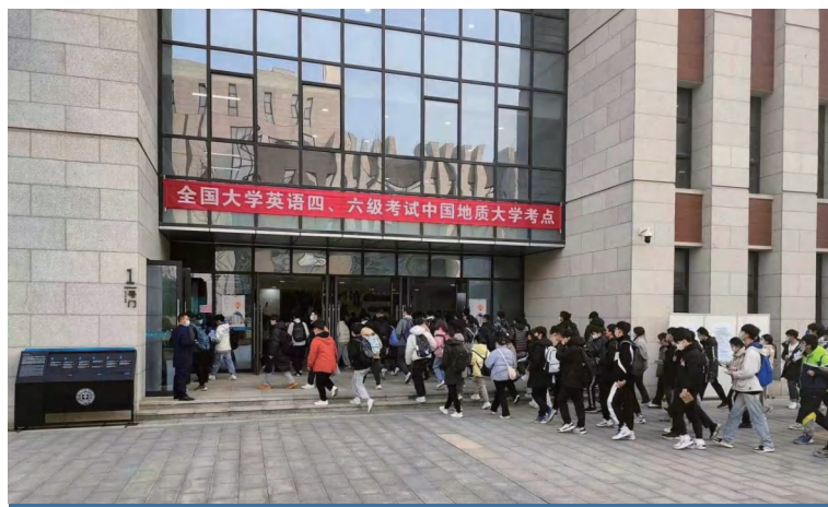
图为四六级考生进入考场所在楼栋

地大新闻网讯（通讯员 王一波）12月10日，2022年下半年全国大学英语四、六考试举行。本次考试在我校南望山和未来城两个校区同步进行，报名总计14972人，共设置502个考场，其中四级考场211个，六级考场291个。选派监考员1000人次，考务工作人员200余人。