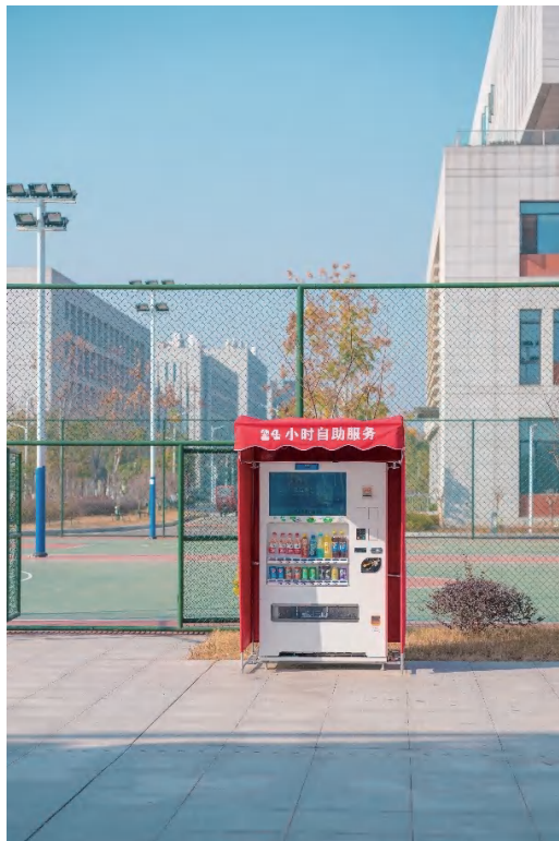
图为校园饮品自助机

2022，我们认真地对待师生在不同渠道提出可行性建议，我们荣幸地收获不期而遇的表扬。2022的最后一天，我们在五湖四海期盼新年，期待2023，我们继续携手相伴，不负热爱，奔赴山海！