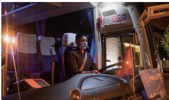
图为返乡直达车行驶现场