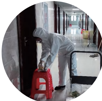
图为核酸消杀现场