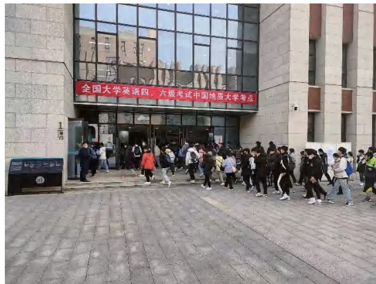
图为四六级考生进场