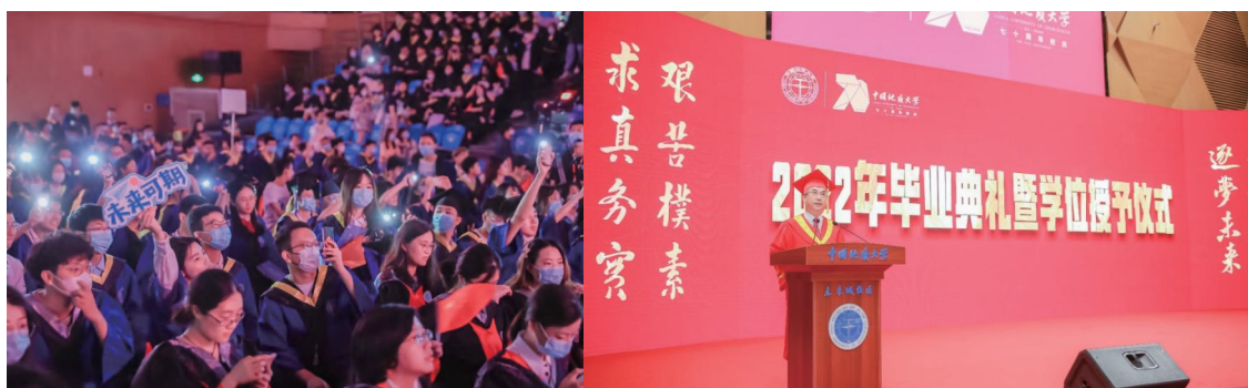
图为毕业典礼现场

6月，第一批入住未来城的同学在这个夏天都毕业了。岱家山下，你我共度美好青春年华，未来人海，祝你前程似锦繁花满路。世界灿烂盛大，常回来看看！