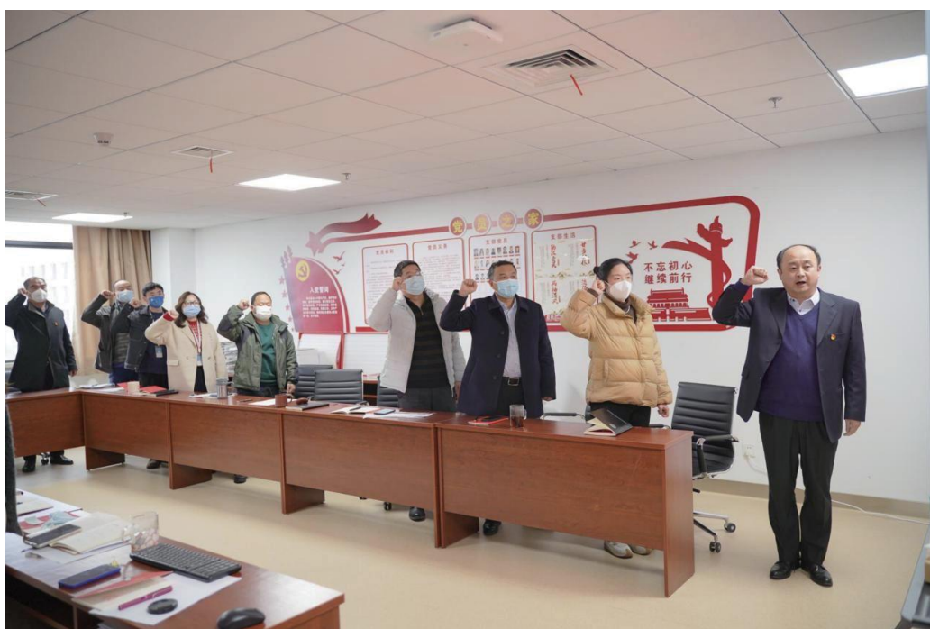
图为全体党员重温入党誓词现场