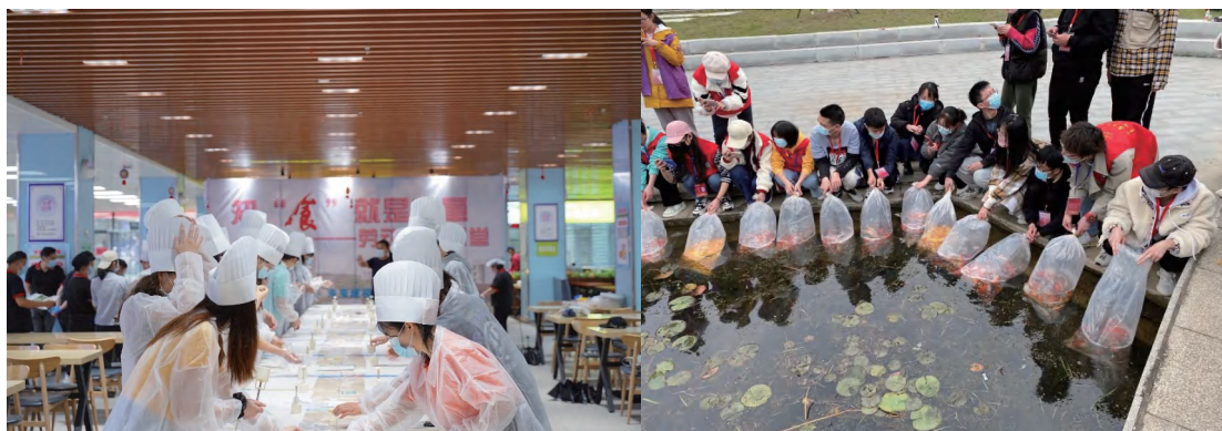
图为志愿活动现场

4月镜湖畔放生锦鲤，5月枇杷树下摘果实，小心地踩上柔软细腻的草坪，拾起一片松脆泛黄的落叶。2022年校区组织了32场劳动实践，900余名学生参与其中，投身劳动，感受生活。